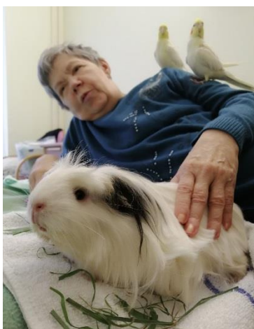
Zig et Puce perchés